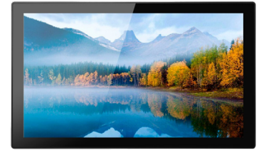
AFFICHAGE DYNAMIQUE OU CAISSE TACTILE?