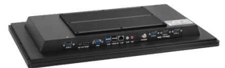
PC INDUSTRIEL PLAT